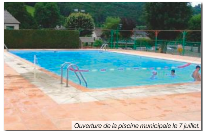
Ouverture de la piscine municipale le 7 juillet.