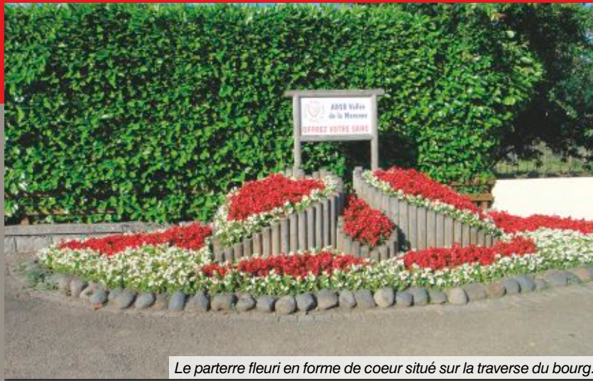
Le parterre fleuri en forme de coeur situé sur la traverse du bourg.