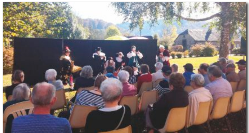
La Troupe de théâtre amateur de St-Cernin : "Le soir à la brune".

De plus, un partenariat avec le réseau Cantal Diabète permettra aux résidents d'assister à des ateliers de prévention autour de la nutrition (et des besoins de la personne âgée) mais aussi des conseils d'un podologue. Ces ateliers se dérouleront au cours du mois de juillet.