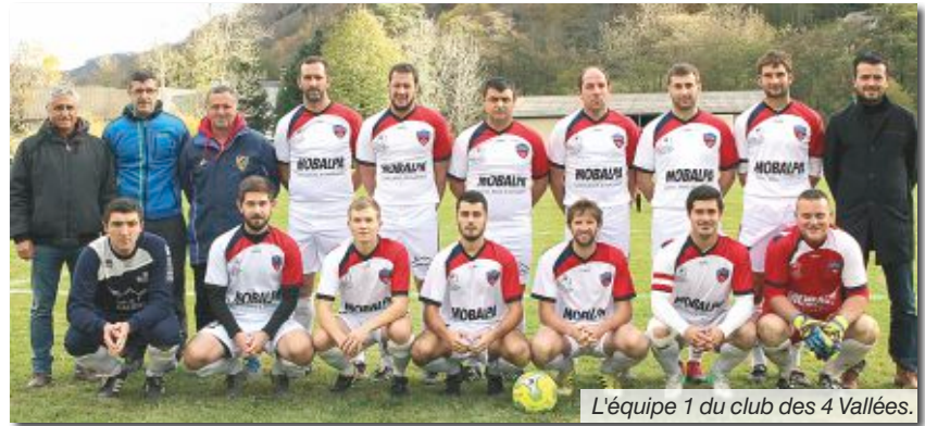
L'équipe 1 du club des 4 Vallées.

L'accueil sera fermé en juillet et en août. Le local ouvrira le 1 er vendredi de septembre. Si des bénévoles sensibilisés par notre action désirent se joindre à nous, nous leur demandons de bien vouloir en faire part à la mairie.