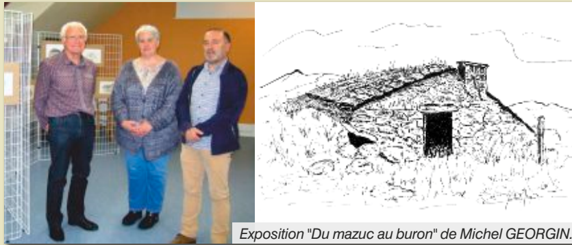
Exposition "Du mazuc au buron" de Michel GEORGIN.