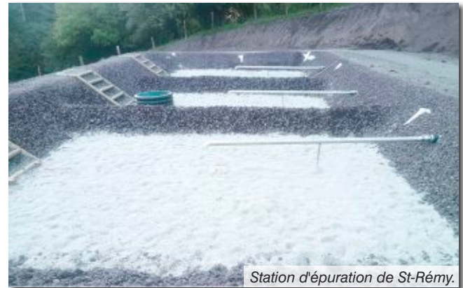
Station d'épuration de St-Rémy.

Ce projet a bénéficié d'un soutien de l'état, du département et d'Adour-Garonne, permettant un financement à presque 80%. Les travaux ont été réalisés par les entreprises Bergheaud (Mauriac) et STAP15 (Naucelles).