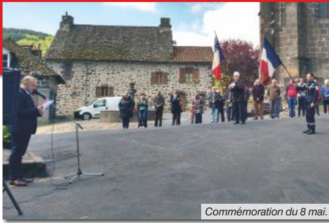
Commemoration du 8 mai.