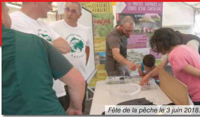
Fête de la pêche le 3 juin 2018.