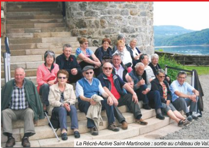
La Récré-Active Saint-Martinoise : sortie au château de Val.