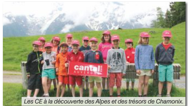
Les CE à la découverte des Alpes et des trésors de Chamonix.

Nous pourrons nous rencontrer le 11 août lors de la Fête d'été. Le matin au four à pain de Salles pour notre vente de pain et à St-Martin pour le repas champêtre.