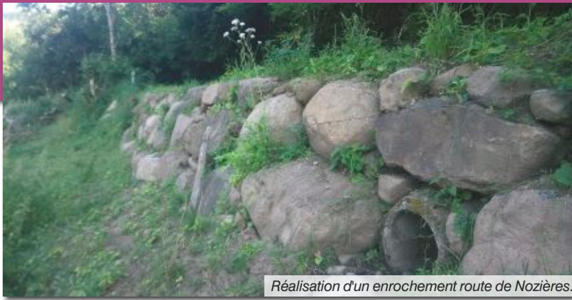
Réalisation d'un enrochement route de Nozières.