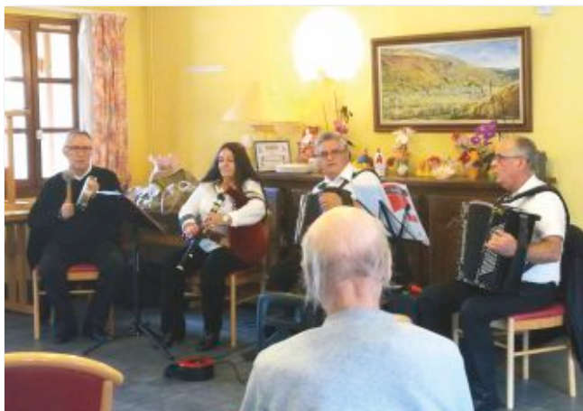
Avec "Cantal Auvergne" : un après-midi cabrette et accordéon.