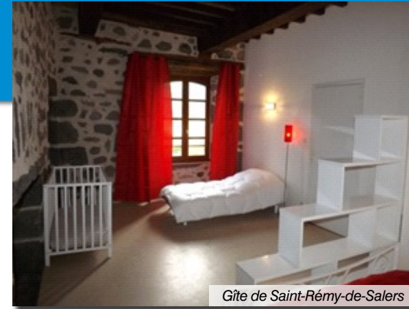
Gîte de Saint-Rémy-de-Salers