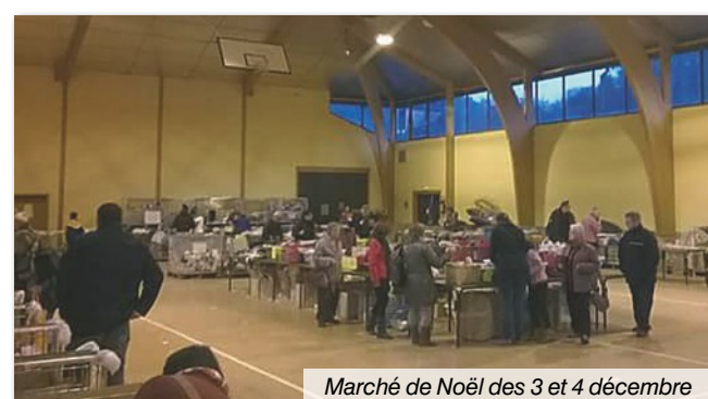
Marché de Noël des 3 et 4 décembre

Pour terminer cette période de fêtes, le maire présentera ses vœux aux habitants le vendredi 27 janvier à 19 h en mairie.