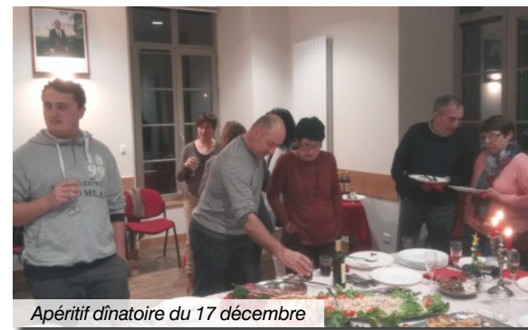
Apéritif dînatoire du 17 décembre

! Pour mémoire, le recensement a débuté le 19 janvier. À cette occasion, un agent recenseur est passé ou va passer à votre domicile.