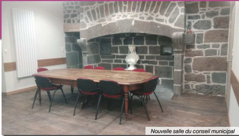
Nouvelle salle du conseil municipal