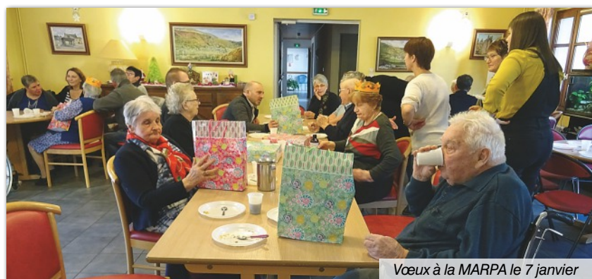
Vœux à la MARPA le 7 janvier

À l'occasion des traditionnels vœux de la municipalité, les élèves participant aux TAP sont venus le 6 janvier préparer la galette avec les résidents. Ces moments de partage ont été appréciés autant par les enfants que par les résidents.