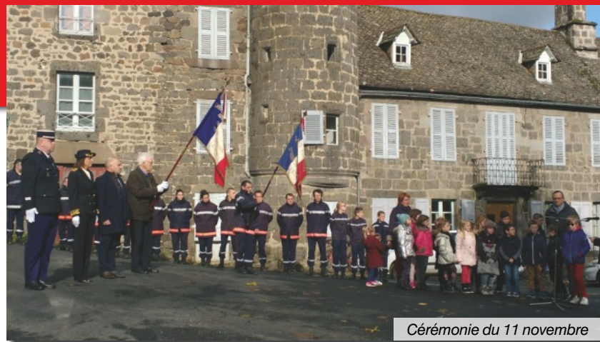
Cérémonie du 11 novembre