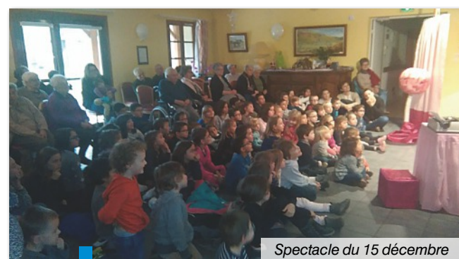
Spectacle du 15 décembre