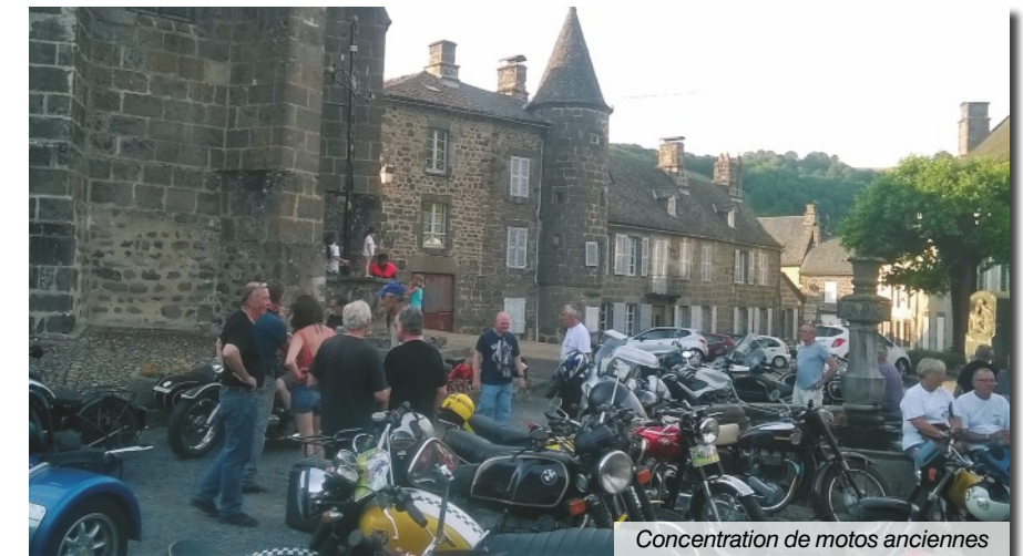
Concentration de motos anciennes

Cette association avait réservé les installations du camping (chalets) et le gymnase pour la restauration (assurée par un restaurateur local).